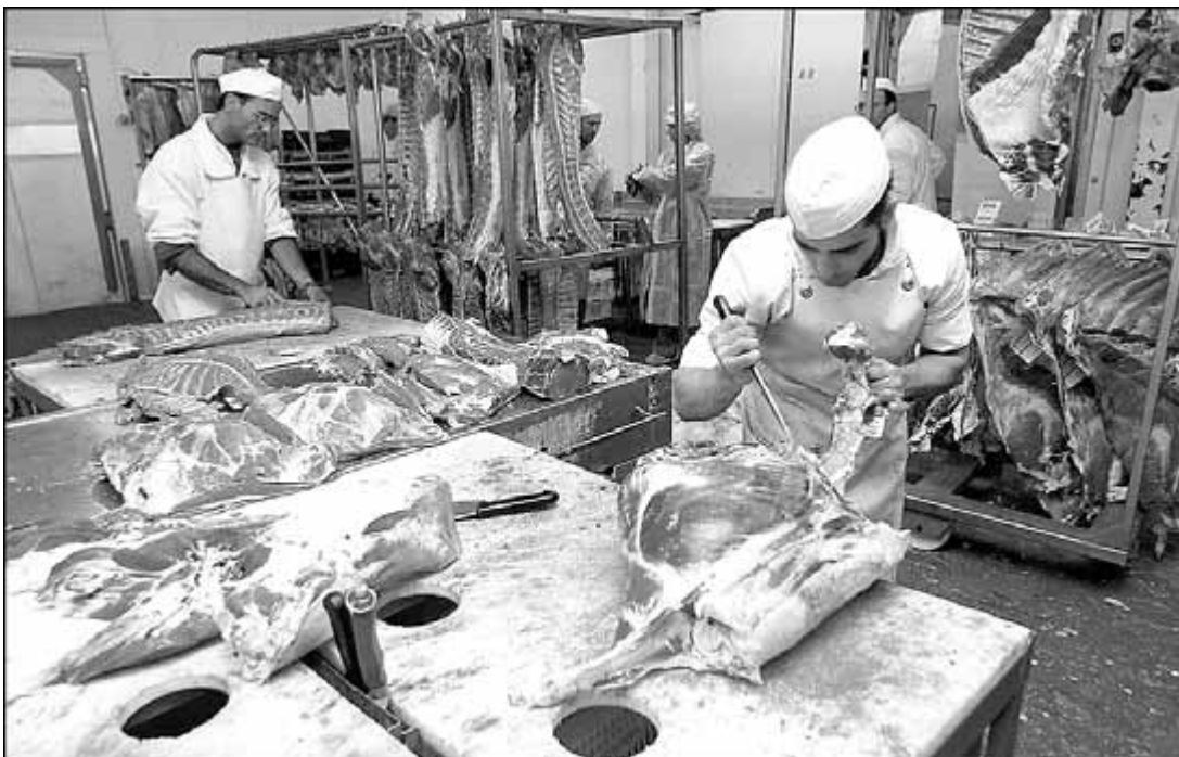
Treballadors en un escorxador de Mercabarna

Aquesta integració de processos, que s'anomena verticalització , es generalitza en el sector carni per dues raons: l'estalvi de costos i la garantia de qualitat.