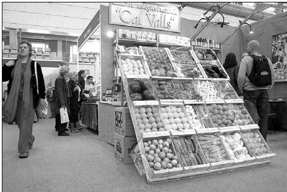
Parada d'aliments ecològics de la fira BioCultura de Barcelona